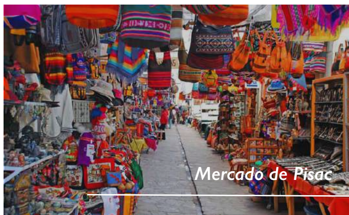
Mercado de Pisac