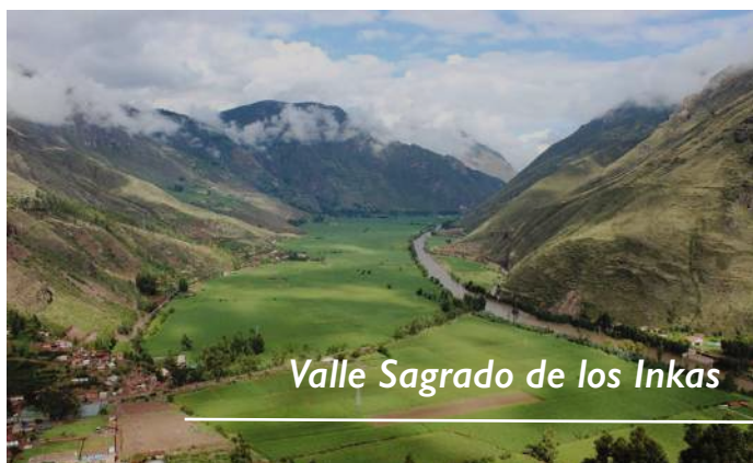
Valle Sagrado de los Incas

Empezaremos con el recojo del hotel 7.20am. Luego se dirigirá al Valle Sagrado de los Incas, tomando la ruta hacia Pisac. Hará una parada en el camino para tener una vista espectacular del Valle Sagrado y del río Vilcanota o Urubamba, serpenteando a través de tapices de cultivos. Primero realizaremos la visita al centro arqueológico de Pisac donde disfrutara de este impresionante lugar; continuando llegará al colorido mercado de Pisac donde dispondrá de tiempo libre para interactuar con los pobladores y artesanos, además de realizar compras de artesanías y recuerdos. Continuará hacia Urubamba para un almuerzo buffet en un restaurante de la localidad. Después de un magnifico almuerzo visitará Ollantaytambo, conocido como la ciudad Inca viviente un atractivo que conserva el origen incaico con notables canales, calles empedradas y angostas. En su parte alta se levanta una impresionante obra maestra compuesto de templos y centros ceremoniales de culto, fue también un acceso importante hacia la selva. Teniendo el tren de las 16:36 desde Ollantaytambo a Aguas Calientes, opcional visitar los baños termales y disfrutar de este lugar; por la noche le estará visitando el guía para darle todas las indicaciones correspondientes para el día siguiente. Pernocte. HOTEL EN AGUAS CALIENTES.