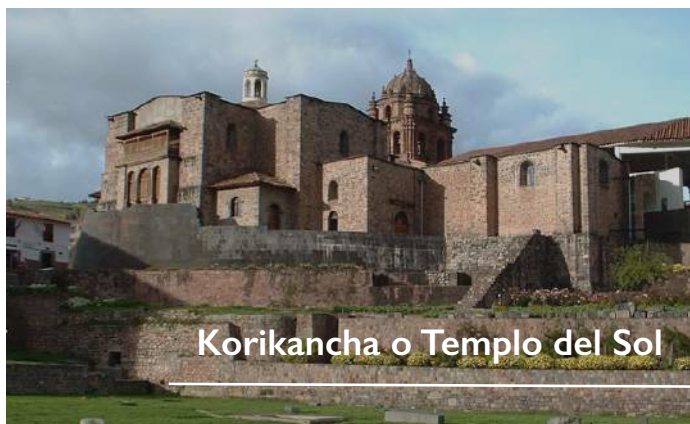
Korikancha o Templo del Sol

Recepción, asistencia y traslado al hotel elegido, mañana libre para adaptarse a la altura que son 3.350 m.s.n.m., se les brindará el mate de coca para que le ayude a aclimatarse. Iniciaremos con el recojo del hotel a las 14 hrs para las visitas al Korikancha o Templo del Sol, una de las primeras construcciones Incas, donde podrá apreciar el finísimo trabajo que los Incas realizaban sobre la piedra. Continuando con el tour se dirigirá hacia Sacsayhuamán, fortaleza con ubicación estratégica, que ofrece una visión sin igual de la ciudad. Apreciará también otros complejos arqueológicos como Kenko, Tambomachay y tendrá una vista panorámica del complejo arqueológico de Puca Pucará hacia la ciudad del Cusco. Noche de HOTEL EN CUSCO.